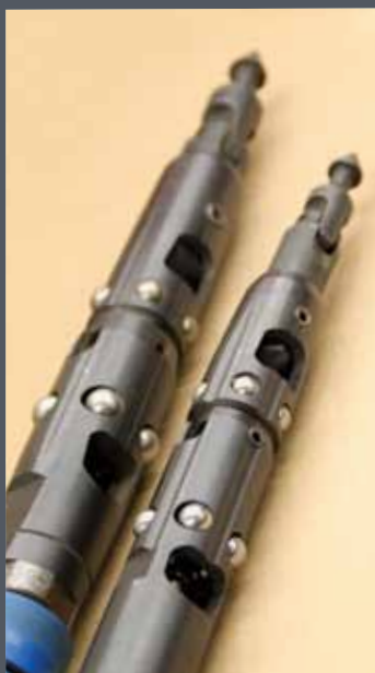
Outillage à câble métallique d'origine Q™