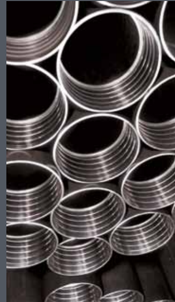
Varillas y ademe