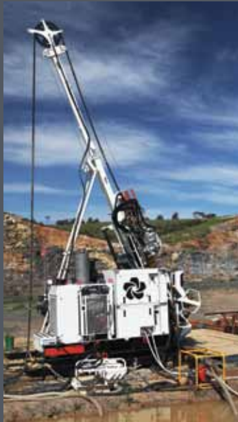
Equipos de diamantes