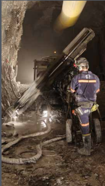
Equipos de producción