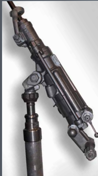
Perforadoras neumáticas para roca